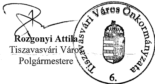
Rozgonyi Attila Tiszavasvári Város Polgármestere

Szorgalmatos, 2009. 2010. 02. 01. napján