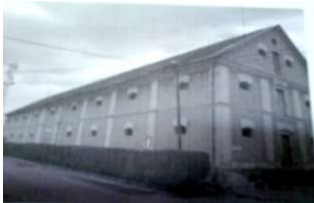
Tiszavasvári város Önkormányzata, Tiszavasvári, Városháza tér 4.