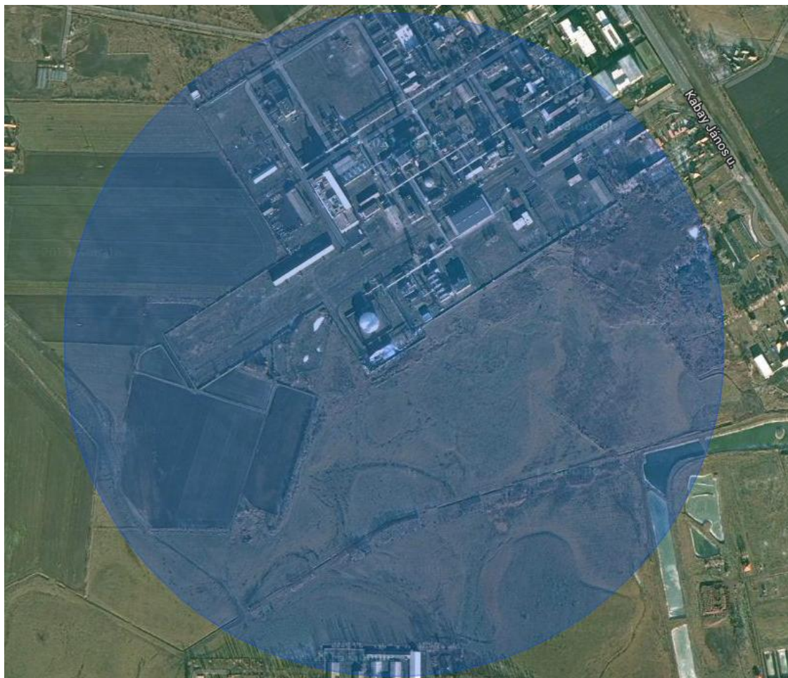
Mérgezés 1%-os halálozás indoor esetben (épületben belül tartózkodókra) Kimenekítési zóna 542 m

A kimenekítési zóna (542 m) nem terjed az Alkaloida Vegyészeti Gyár Zrt. telephelyének területén kívülre, csak a telephely területén tartózkodókra érvényes.