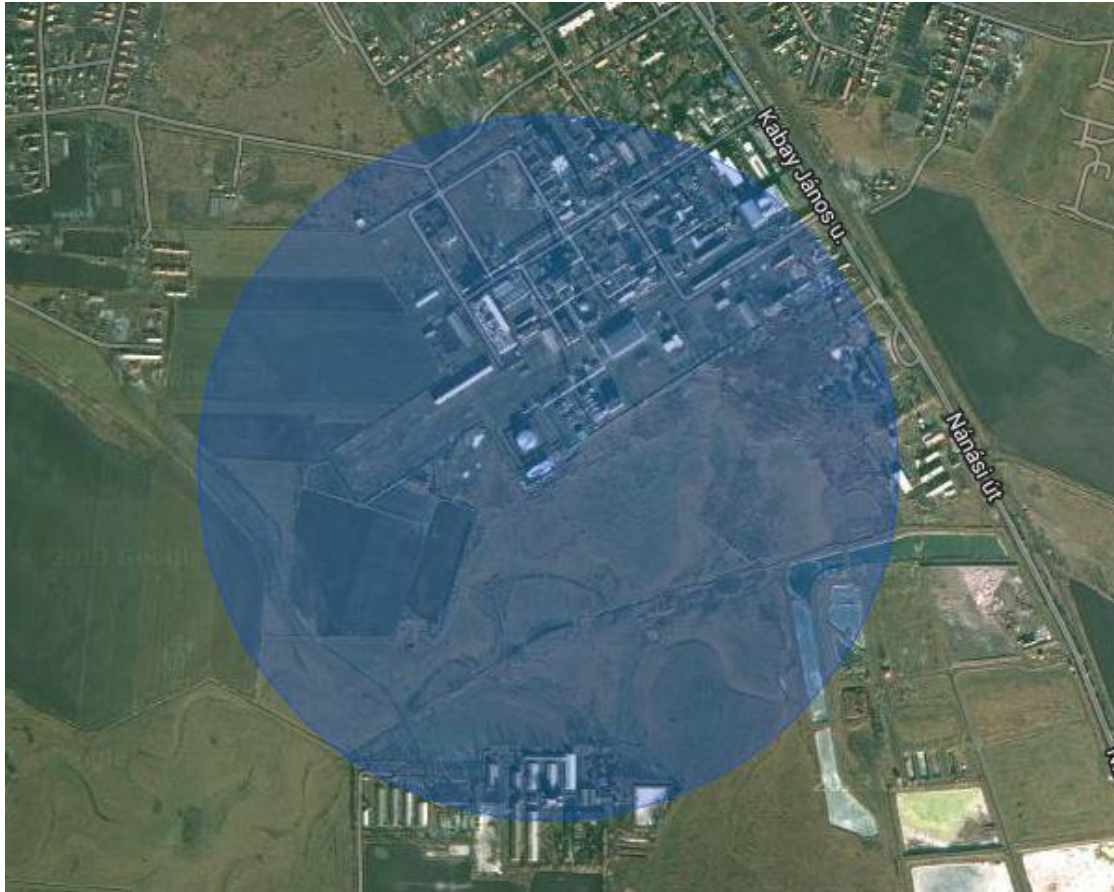
Mérgezés 1%-os halálozás outdoor esetben (szabadban tartózkodókra) Tájékoztatói zóna 602 m

Az üzemben bekövetkező veszélyes esemény következtében kijutó mérgező gáz (pl. hidrogén-cianid) veszélyt okozó hatásának legnagyobb távolsága a kibocsátóforrástól 602 m az aktuális szélirányban. A legnagyobb, csak rendkívül kedvezőtlen időjárási körülmények közt várható toxikus hatósugar éppen eléri a lakott területeket, ennek hatása más üzemeltetőket veszélyeztethet az Alkaloida Vegyészeti Gyár Zrt. telephelyén és a déli irányban a mezőgazdasági területeken, valamint –igen ritkán előforduló szélirányok esetén– érinthetnek a lakóterület szélén 6 lakóházat és annak lakóit.