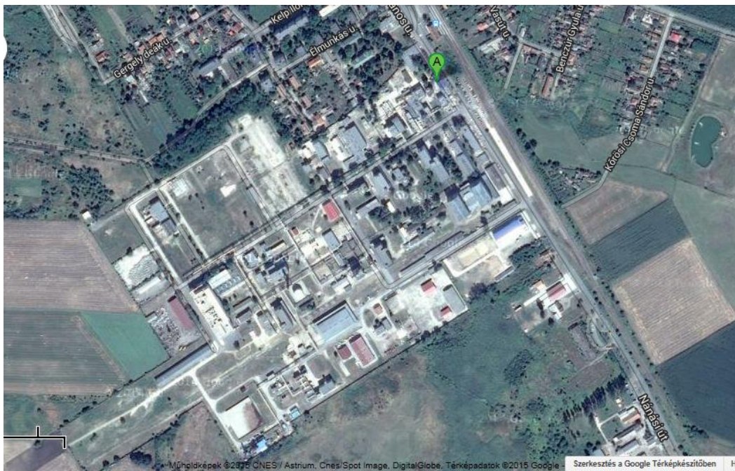
Ecomissio Kft. elhelyezkedése az Alkaloida Vegyészeti Gyár Zrt. telephelyén