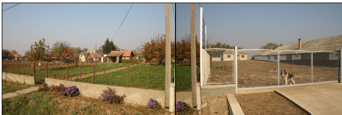
1.-2. számú kép

A vizsgált terület szabályozási terv szerinti alapállapota